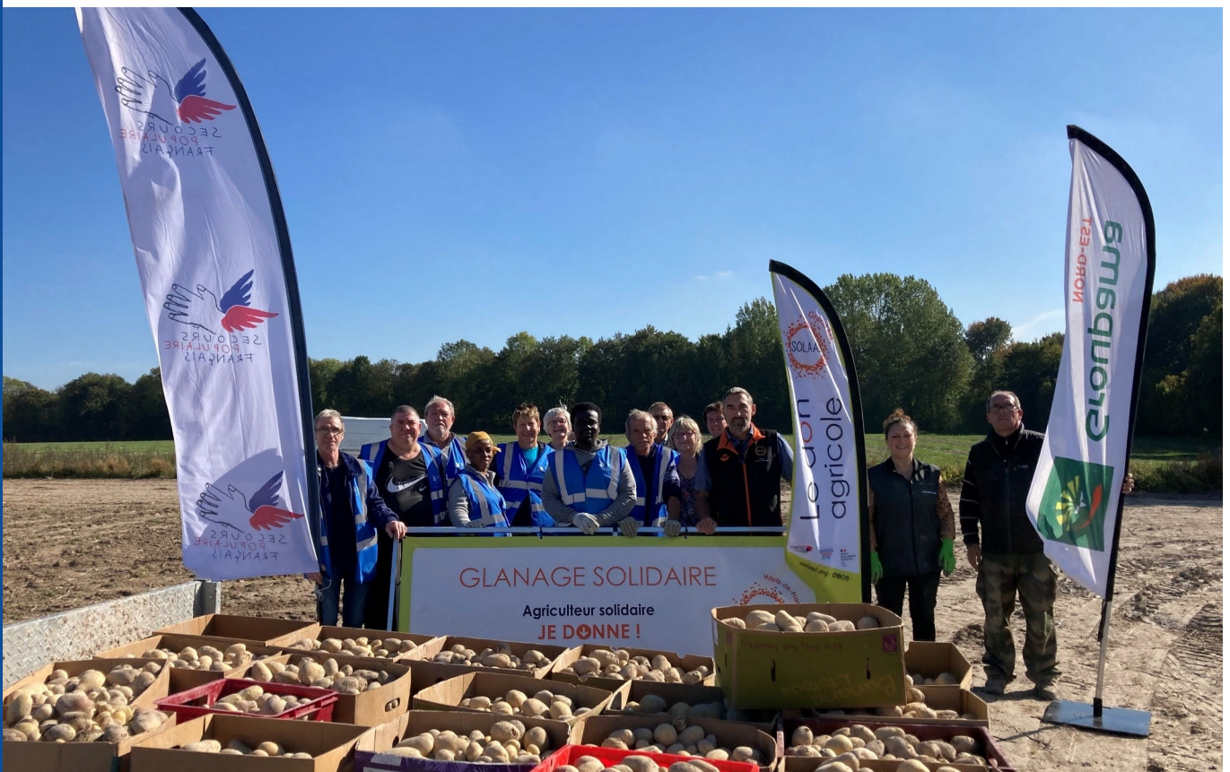
Glanage à Warmeriville (51) en partenariat avec Groupama Nord-Est

bénévole équipe communication du Secours populaire français, fédération de la Marne