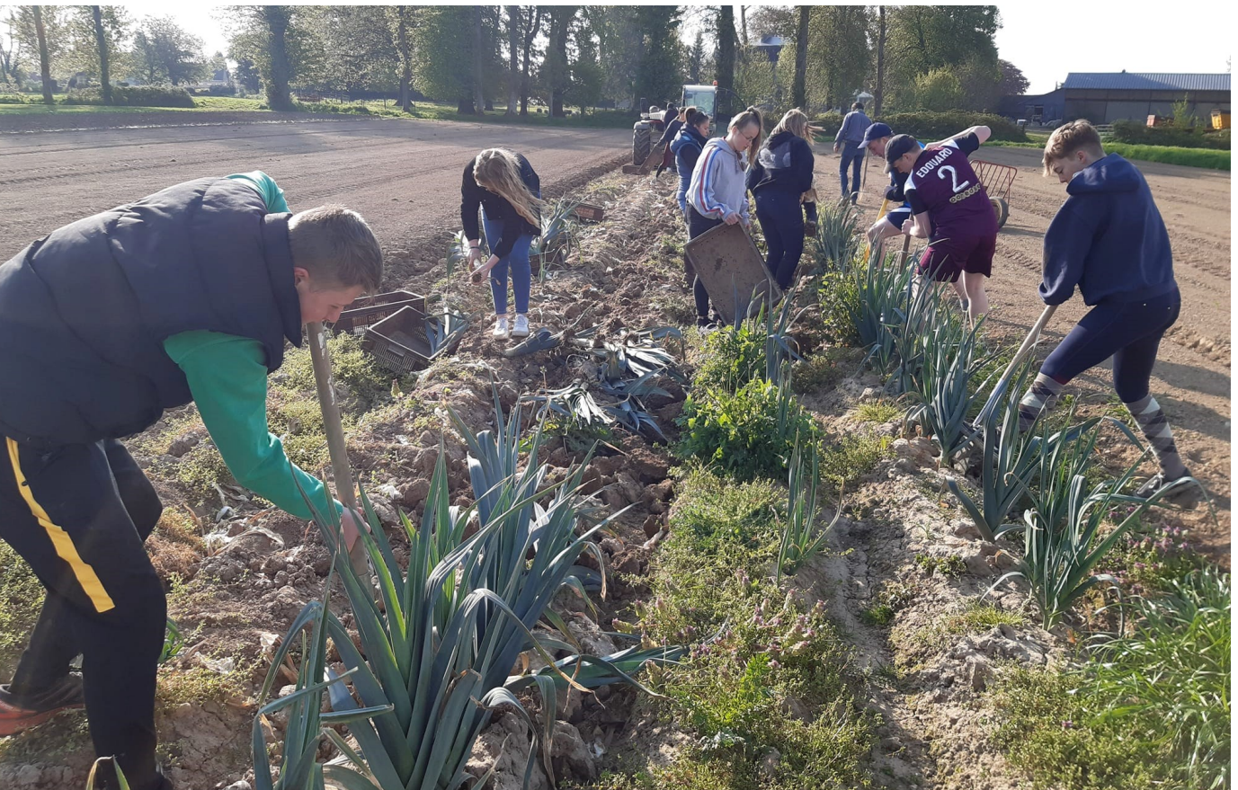
Glantage de poireaux par les étudiants de la Maison familiale et rurale de Rollancourt chez l'EARL Dransart (62)

Enfin, concernant la communication pendant l'événement, des prestataires partenaires (photographe, vidéaste, relations publiques, etc.) pourront aider à le valoriser.