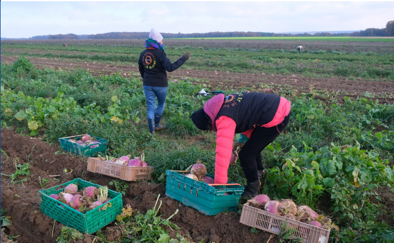
Glanage de navets dans l'exploitation SCEA des Séquoia (91)

En fonction de l'organisation de l'événement, des partenaires sont à envisager en termes de conditionnement du produit et du transport.