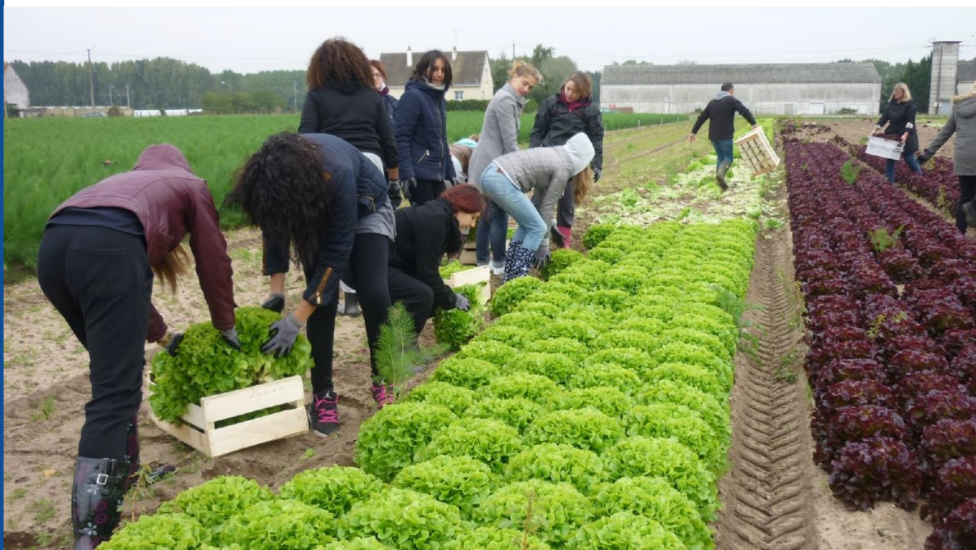
Glanage de salades réalisé chez Delahaye Maraîcher (37)