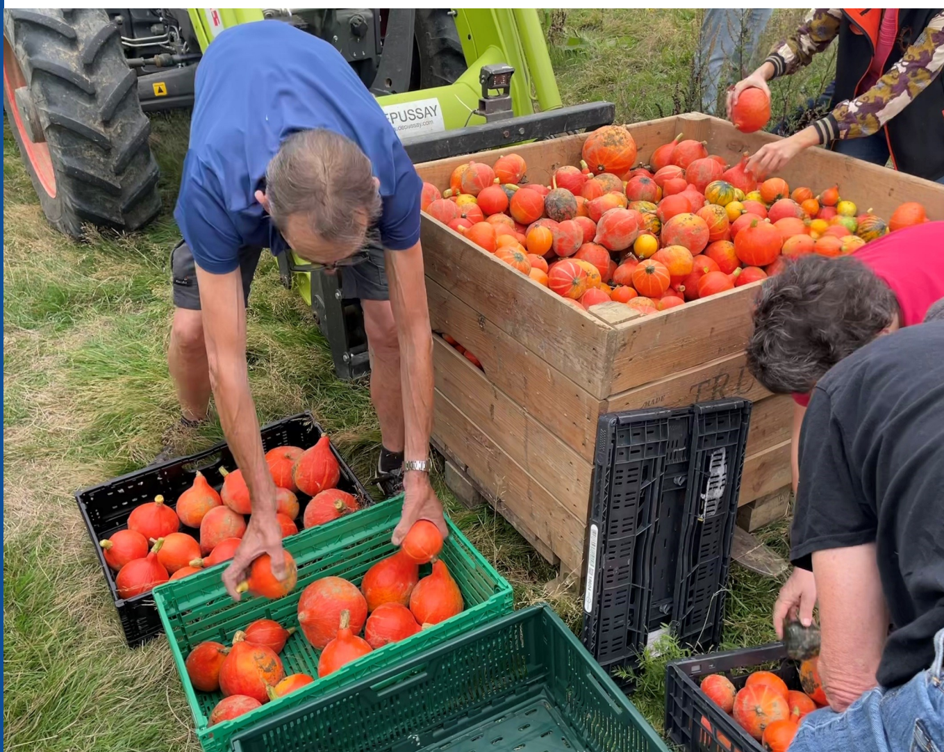
Glanage de potimarrons réalisé avec la Ferme Trubuil et en partenariat avec l'EPA Paris Saclay

Par ailleurs, toute personne qui réalise un glanage devra s'assurer au préalable d'avoir soit une assurance civile soit d'être rattachée à l'assurance de l'organisme qui organise le glanage.