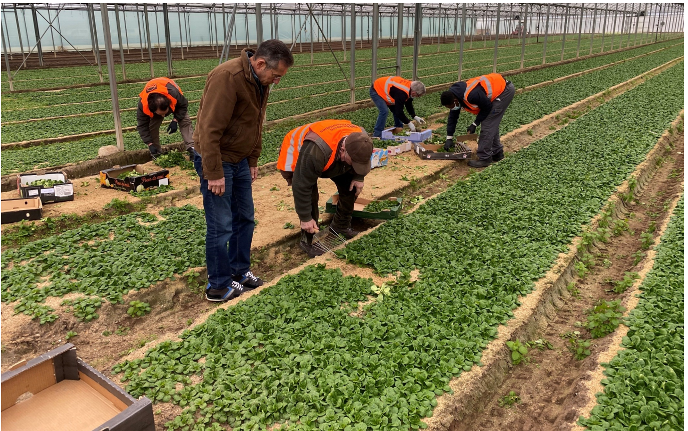
Glanage de salades hebdomadaire, réalisé chez Delahaye Maraîcher (37)

Le conventionnement avec une association locale pratiquant le glanage permet la mise en place d'un dispositif plus encadré et pouvant favoriser l'insertion de personnes en difficulté. » 1 Le glanage est ainsi défini selon le ministère de l'Agriculture et de la Souveraineté alimentaire.