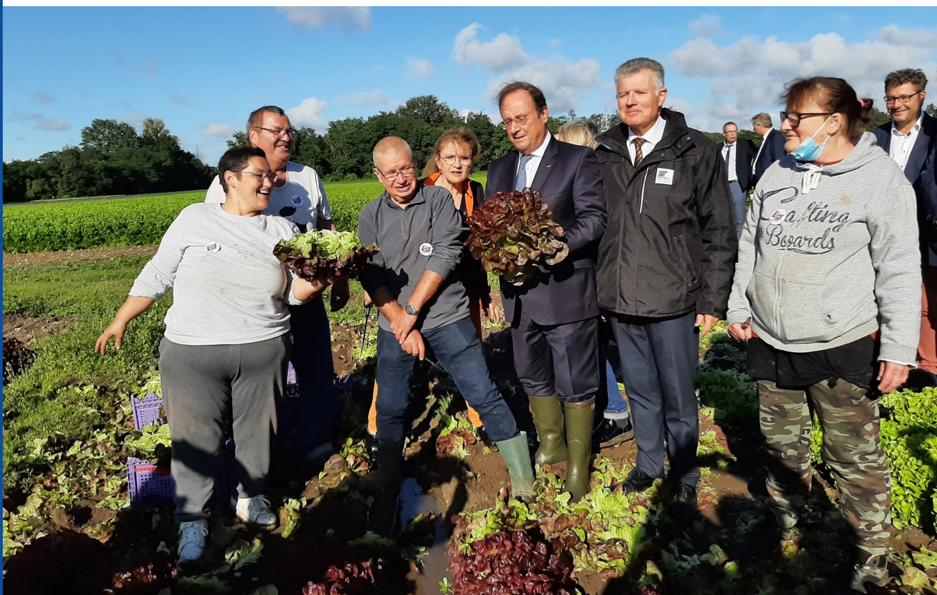
Glanage de salades chez Delahaye Maraîcher, réalisé par des bénéficiaires de l'aide alimentaire et des bénévoles, en présence de François Hollande, président de la Fondation la France s'engage