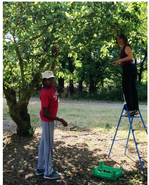
Glanage de cerises dans le Loiret par l'UDAF 45

Une vigilance particulière sera nécessaire pour ce type de production. En effet, sans formation préalable par le producteur, le risque d'abîmer les arbres est non négligeable.