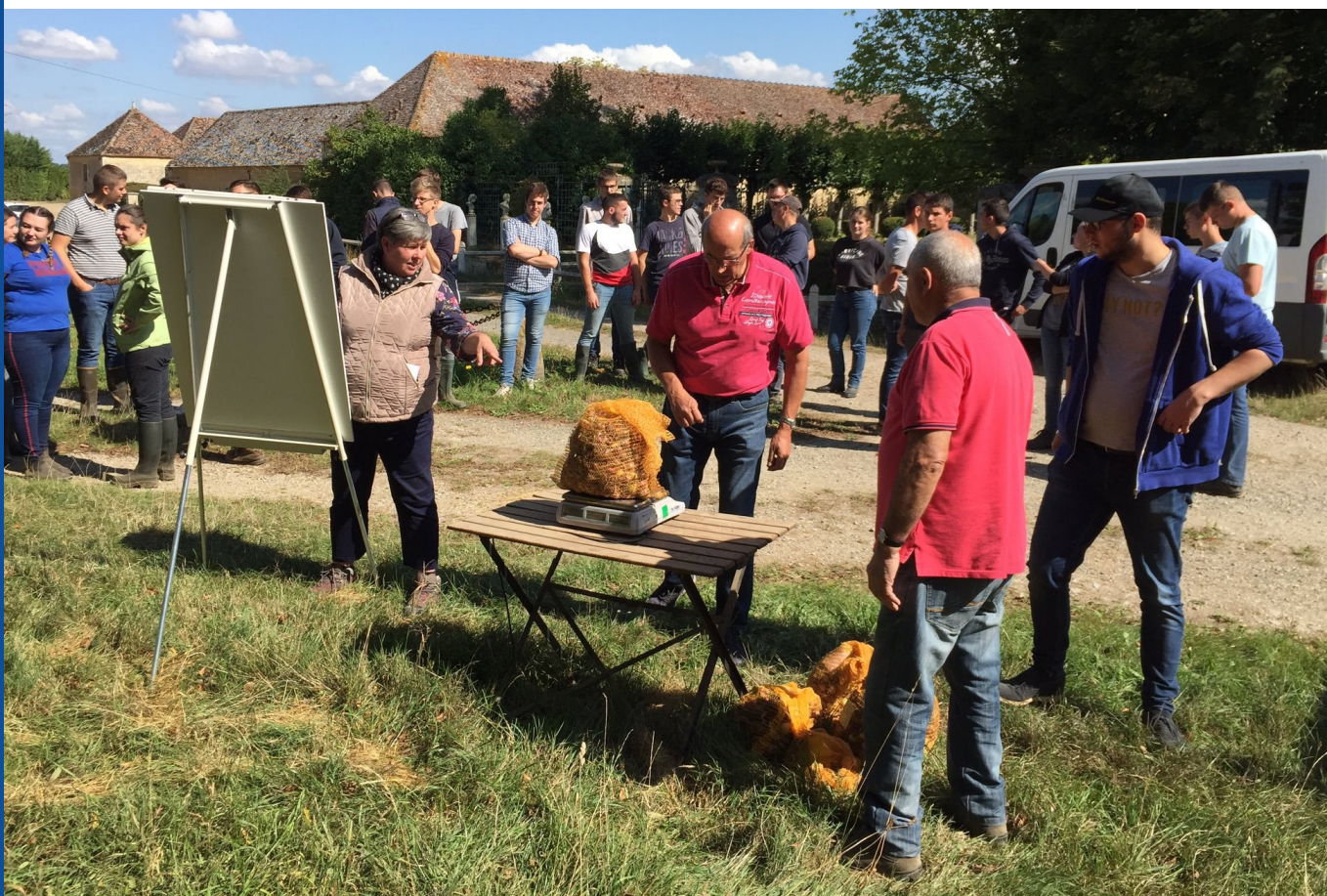
Challenge pour animer la journée : pesée des produits pour valoriser les équipes qui ont le plus glané !

En début de journée, afin de mobiliser les volontaires participants, un jeu concours peut également être proposé. Les thématiques peuvent être multiples : avoir glané le plus de produits possibles, estimer le poids final glané, réaliser un challenge à atteindre, un quizz sur l'aide alimentaire, etc.