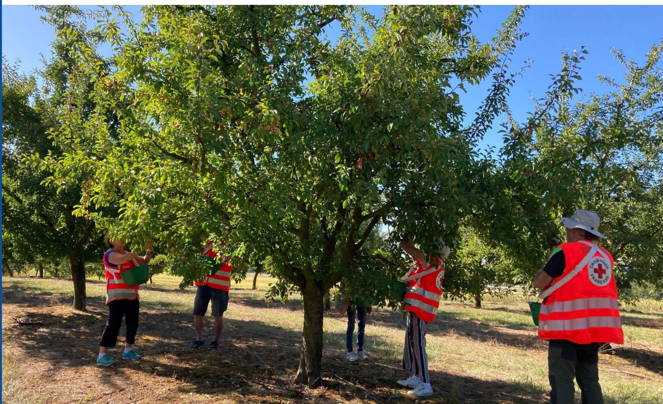
Glanage de mirabelles par les bénévoles de l'Unité locale de Lunéville de la Croix-Rouge française (54)

Présidente de l'Unité Locale de Lunéville de la Croix-Rouge française