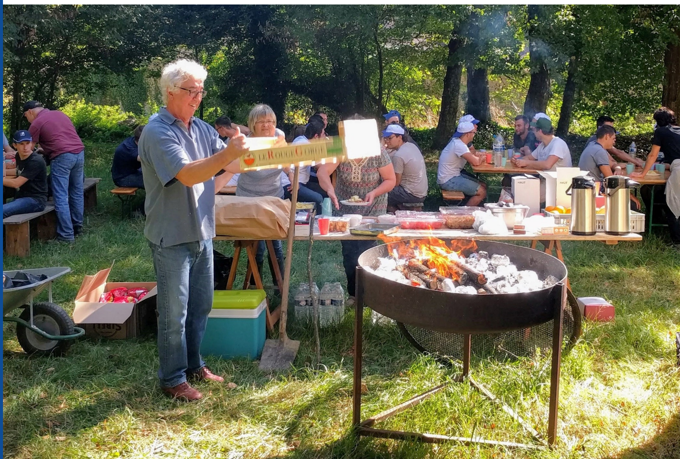
Restauration pendant glanage avec le lycée agricole le Robillard et la MSA Côtes Normandes

Un moment de collation ou restauration pourra également être prévu. En fonction du format choisi, ce moment peut être l'occasion d'une animation, d'information ou de sensibilisation. Les témoignages de l'agriculteur qui accueille l'événement ainsi que de l'association bénéficiaire permettront en effet de sensibiliser les volontaires aux problématiques rencontrées par chacune des parties.