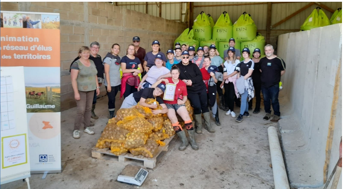
Glanage par les étudiants de la MFR de Trun, à la Ferme d'Ailly (14)

Partager les photos et témoignages des participants motiveront également les volontaires sur les éditions futures. En annexe du guide, un exemple de remerciements est proposé.