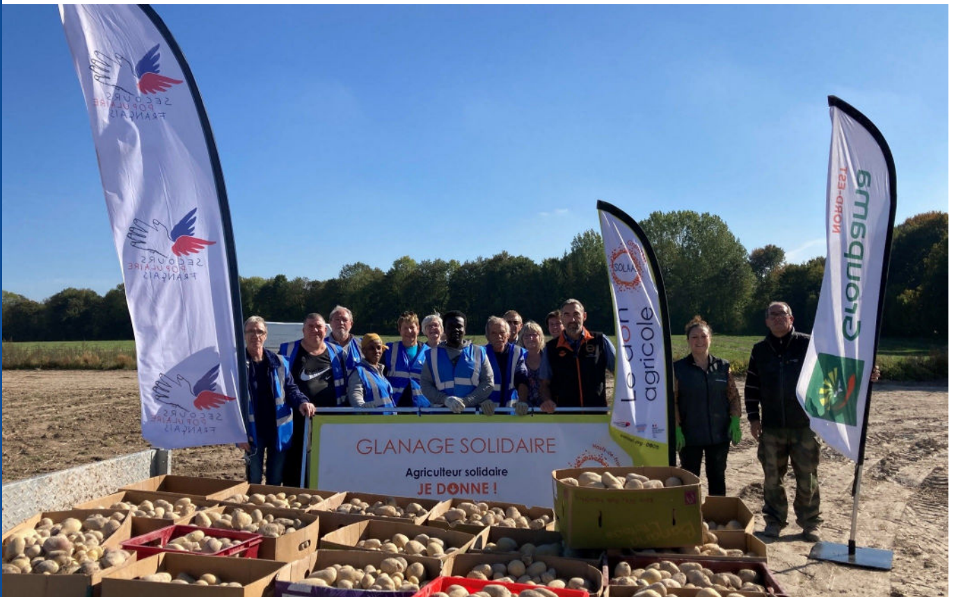
Glanage à Warmeriville (51) en partenariat avec Groupama Nord-Est

bénévole équipe communication du Secours populaire français, fédération de la Marne