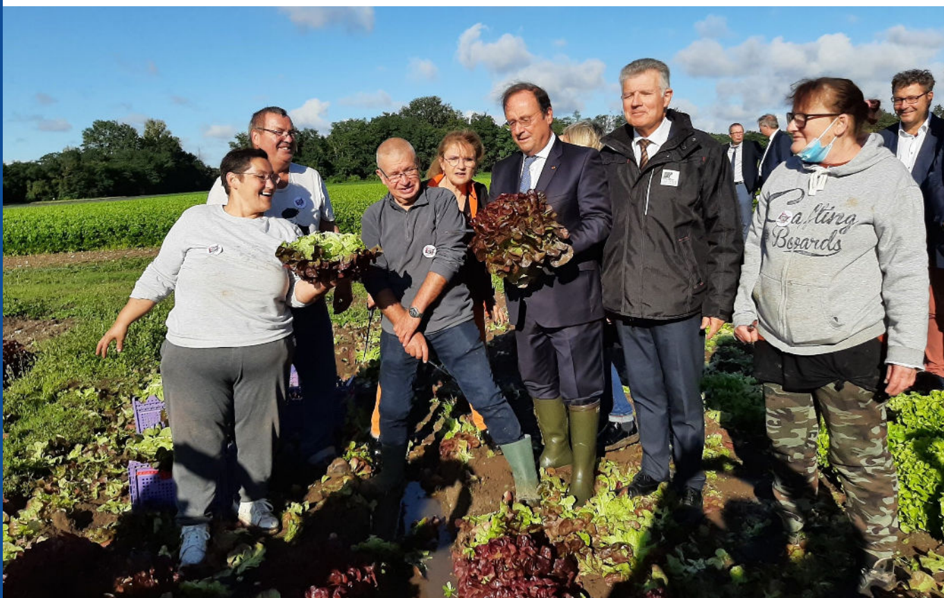
Glanage de salades chez Delahaye Maraîcher, réalisé par des bénéficiaires de l'aide alimentaire et des bénévoles, en présence de François Hollande, président de la Fondation la France s'engage