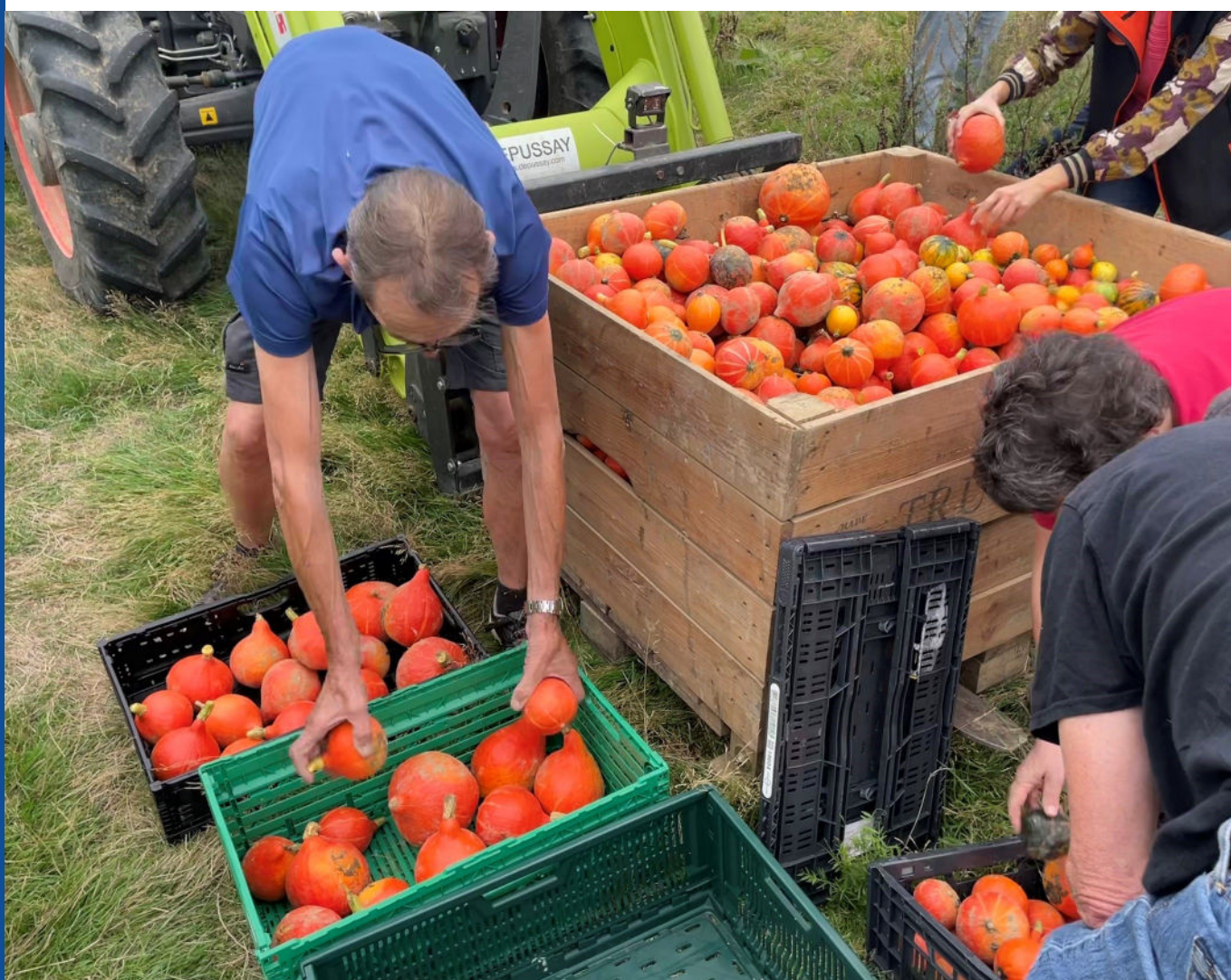
Glanage de potimarrons réalisé avec la Ferme Trubuil et en partenariat avec l'EPA Paris Saclay

Par ailleurs, toute personne qui réalise un glanage devra s'assurer au préalable d'avoir soit une assurance civile soit d'être rattachée à l'assurance de l'organisme qui organise le glanage.