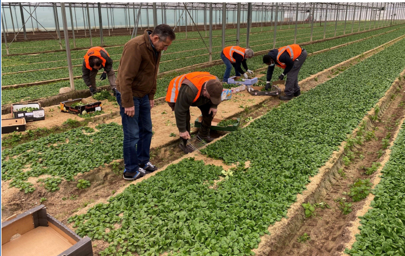
Glanage de salades hebdomadaire, réalisé chez Delahaye Maraîcher (37)

Le conventionnement avec une association locale pratiquant le glanage permet la mise en place d'un dispositif plus encadré et pouvant favoriser l'insertion de personnes en difficulté. » 1 Le glanage est ainsi défini selon le ministère de l'Agriculture et de la Souveraineté alimentaire.