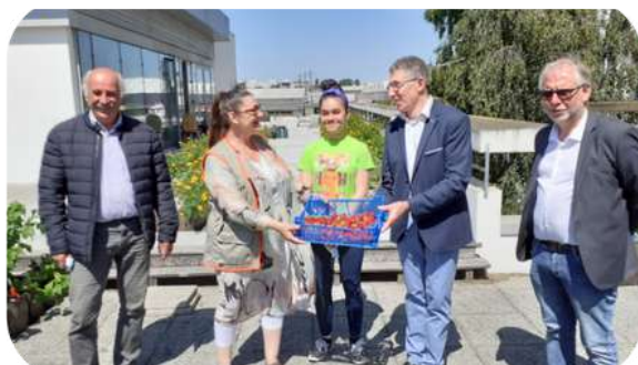
Dons de fruits et légumes en Pays-de-la-Loire