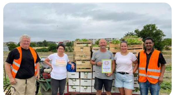
Glanage solidaire en Occitanie