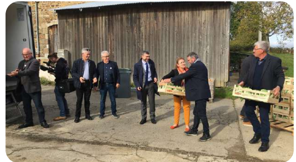
Chaîne du don Inauguration SOLAAL Bretagne