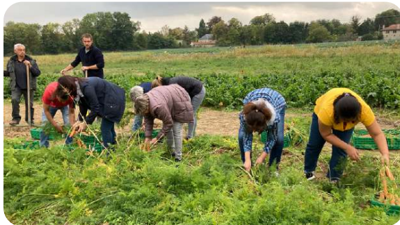
Glanage solidaire en Grand Est