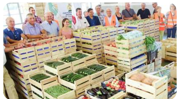
Collecte de produits au M.I.N Châteaurenard