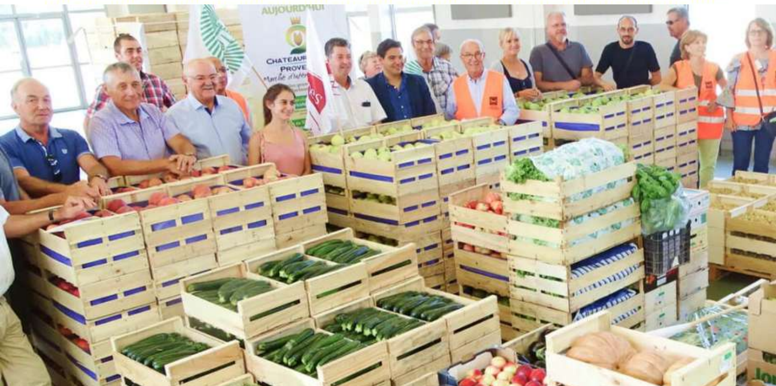
Dons organisés sur le MIN de Châteaurenard à l'occasion de la Journée nationale du don agricole (2020)