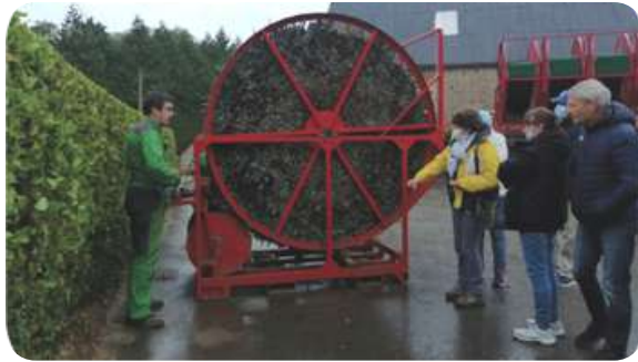
Visite solidaire par des bénévoles en Normandie

Les antennes territOriales développent les dons de proximité. Elles organisent des actions collectives solidaires et rencontrent les parties prenantes.