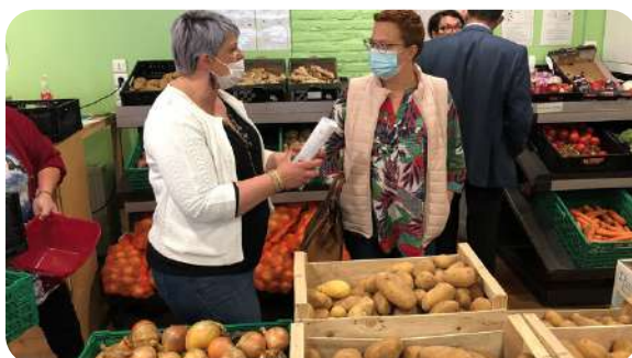
Visite solidaire d'association en Hauts-de-France