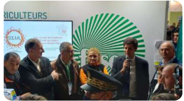
Salon de l'élevage Inauguration SOLAAL AURA