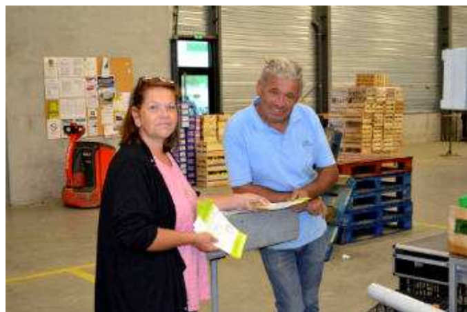
Distribution de flyers SOLAAL sur le marché de gros de Lyon-Corbas

Les relais locaux de SOLAAL sont à l'origine de dons de proximité et d'actions de sensibilisation lors de salons, foires etc.