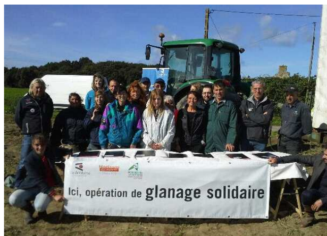
Les bénévoles du Pôle ESS ont glané sur les terres des agriculteurs du Pays de Saint-Malo

Le glanage solidaire, organisé par SOLAAL, fait partie des cent initiatives exemplaires présentées dans le programme La solution est dans l'assiette! de la Fondation GoodPlanet, fondée par Yann-Arthus Bertrand. Elle a pour objectifs de « mettre l'écologie au cœur des consciences et de susciter l'envie d'agir concrètement ».