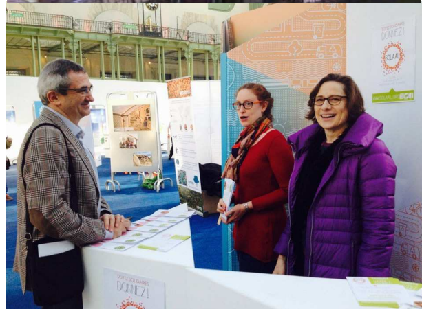
SOLAAL au Grand Palais pour la COP 21