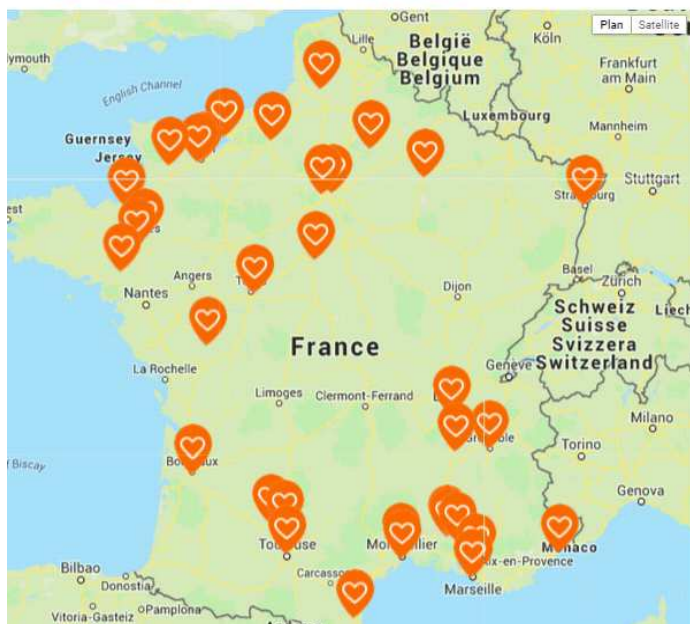
Une quarantaine d'actions lors de la Journée nationale du don agricole