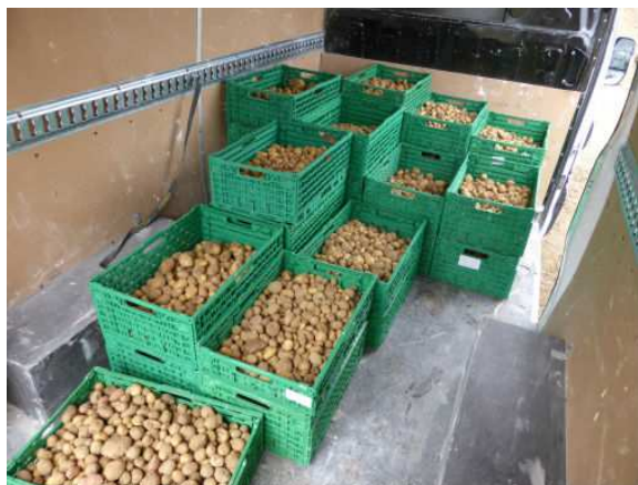
500 kg ramassées par les bénévoles de Disco Soupe