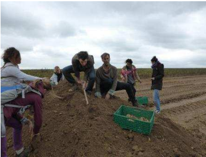
Tristram Stuart, qui lutte contre le gaspillage alimentaire dans le monde, met la main à la pâte !