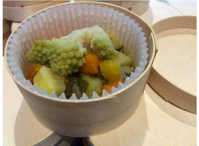
Des légumes invendus ont été cuisinés pour les représentants du Programme des Nations unies pour l'environnement lors de la COP 21

SOLAAL a été invitée par le Conseil régional de l'Ile-de-France à participer à la COP 21 et à échanger autour des enjeux de l'économie circulaire lors d'une conférence le 1 er décembre 2015 ayant pour thème : « La lutte contre le gaspillage alimentaire : un maillon de l'économie circulaire ». L'association a également été présente, grâce à la Fondation Avril et la Fondation Good Planet, les 4 et 8 décembre au Grand Palais à Paris, pour échanger avec le public sur les questions du gaspillage alimentaire.