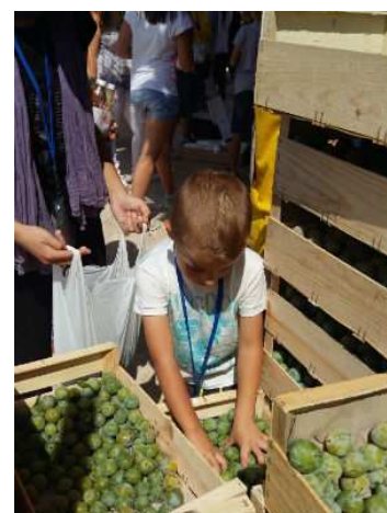
Distribution de prunes lors de la Journée pour les oubliés des vacances organisée par le Secours populaire français