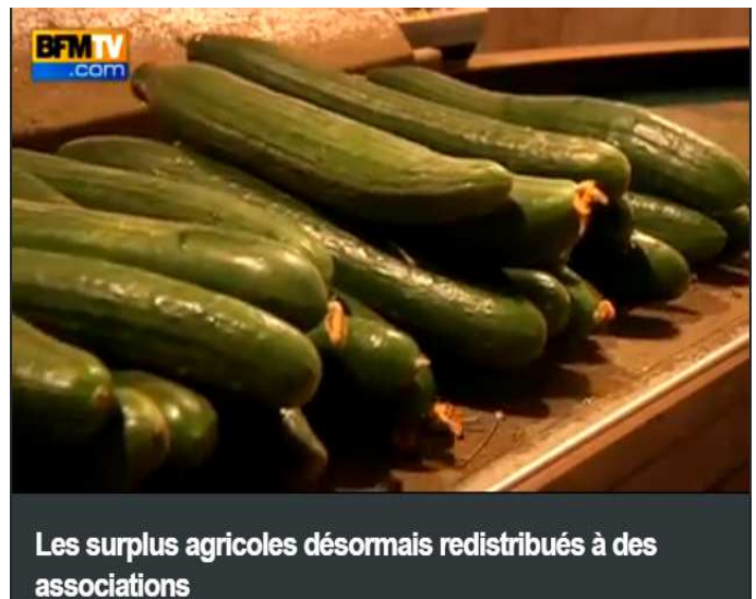
Reportage BFM sur le don de concombres acheminés sur la plateforme créée sur le marché de gros de Tours, en partenariat avec Tour(s)Plus

Lancé en mars 2015, le dispositif a permis de faciliter le don de 15,5 tonnes de pommes de terres à trois associations locales d'aide alimentaire : la Croix-Rouge française, le Secours Populaire français et la Banque Alimentaire.