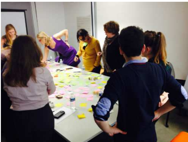
Des salariés bénévoles de SUEZ Environnement réfléchissent pour SOLAAL lors d'un atelier collaboratif organisé par Make sense

En septembre, à l'occasion de la Journée nationale du don agricole, SOLAAL Bretagne a réalisé une à deux actions de glanage solidaire par semaine avec le Pôle ESS du Pays de Saint-Malo. Cette action a été organisée avec des personnes en insertion. Au total, ce sont 2,4 tonnes de pommes de terre qui ont été récoltées sur environ 8 ha, puis transmises aux associations d'aide alimentaire. Ce sont onze producteurs du Pays de Saint-Malo qui ont répondu favorablement et souhaitent renouveler leur proposition en 2016.