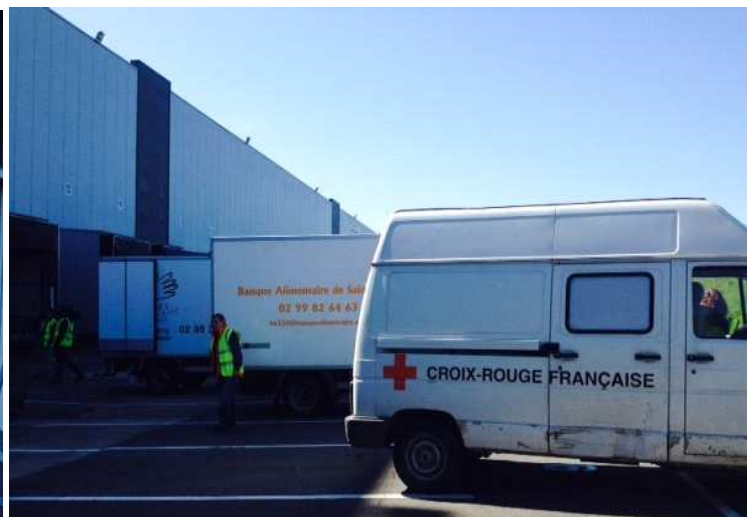
Dons de pommes de terre transportées par la Supply chain de Carrefour en Bretagne...